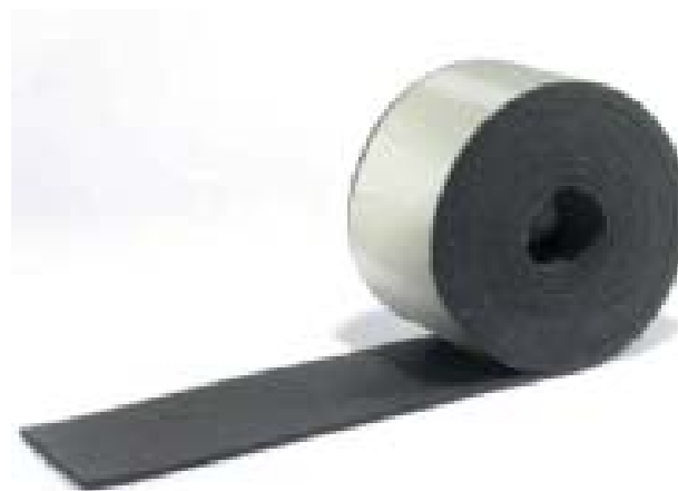
Belastning pr. løbende meter (kg)