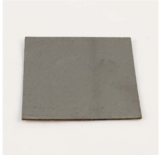
Tabsfaktor for LD13 monteret på en 1 mm stålplade ved forskellig frekvenser

Sugende underlag, som f.eks. ubehandlede træplader bør primes med en kontaklim type 555.